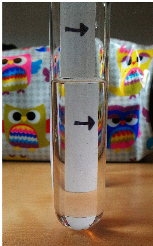
Tube à essais + flèches de même sens !