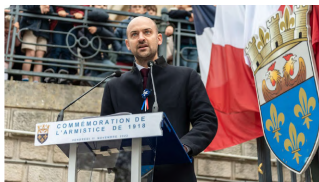
Ministre délégué chargé de la Transition numérique et des Télécommunications