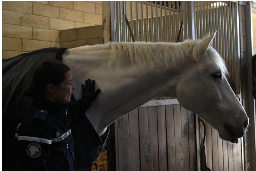
Ubac, cheval de la Garde Républicaine