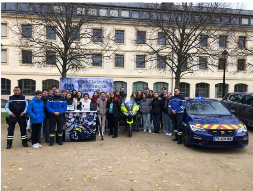
L'EDSR de Versailles au lycée Hoche – 30/11/2022