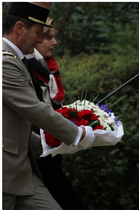
Dépôt de gerbe auprès du monument aux morts