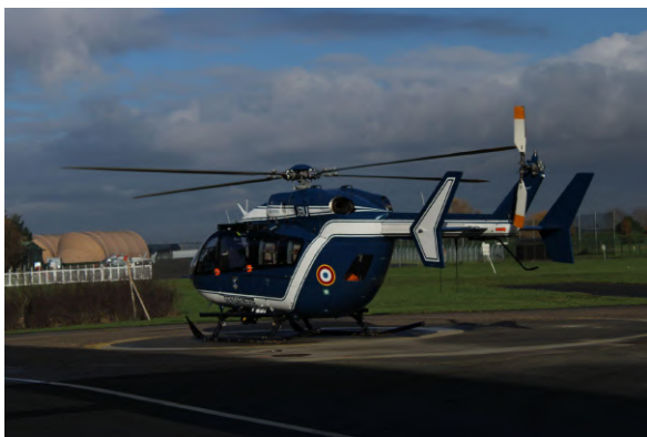
L'hélicoptère prêt à décoller