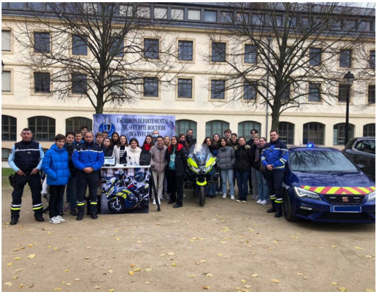
La Classe Défense et l'EDSR du Groupement de Gendarmerie Départementale des Yvelines