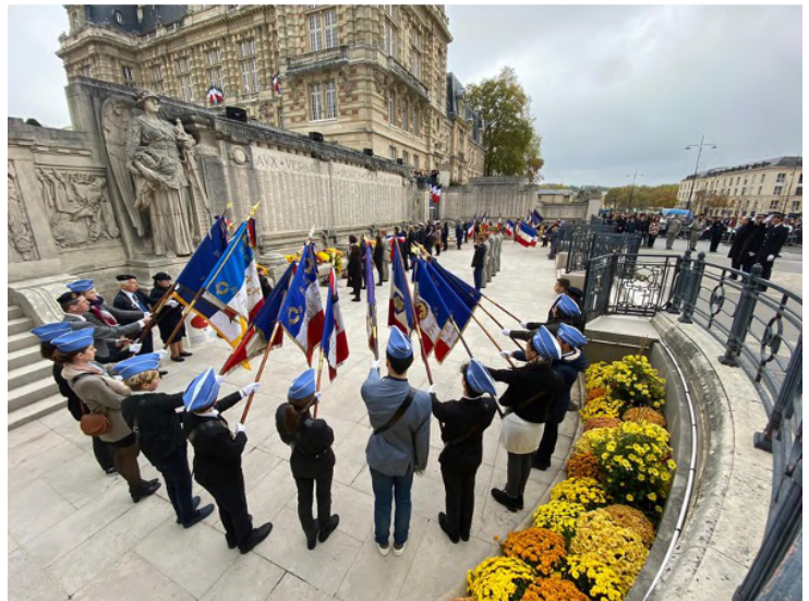
Cérémonie de commémoration du 11 novembre à Versailles – 11/11/2022