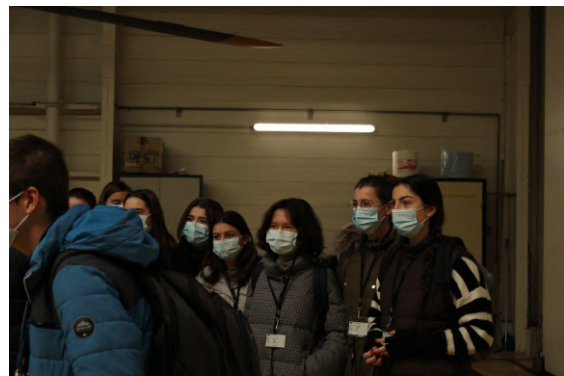
Discussion avec une jeune femme pilote dans la Gendarmerie Nationale