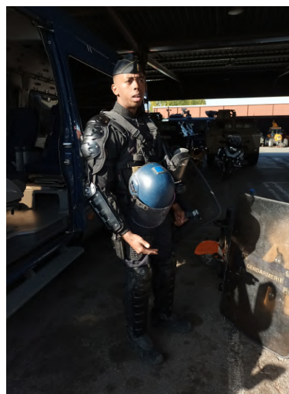
Un gendarme mobile du PI équipé pour le maintien de l'ordre