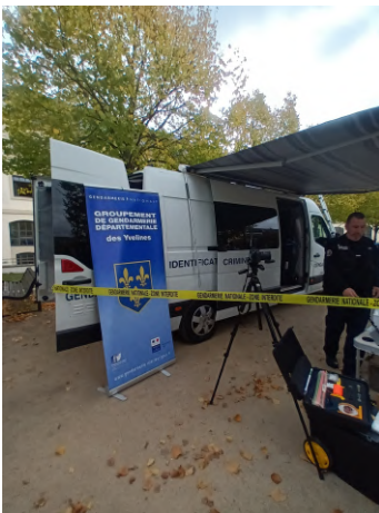
Camionnette d'intervention accompagnée de leur matériel spécifique

Cette intervention nous aura donc permis de découvrir une nouvelle facette de la Gendarmerie Nationale.