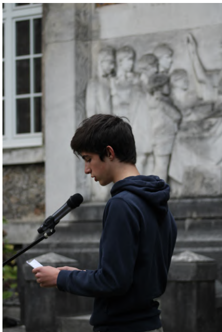
Récitation de poèmes et d'écrits personnels