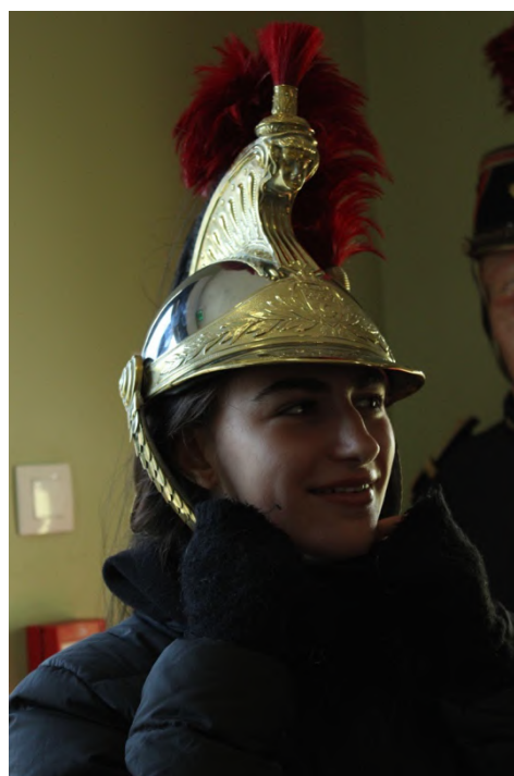
Équipement de cérémonie du cavalier de la Garde Républicaine