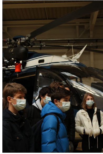
Moment d'écoute attentive sur l'expérience des pilotes d'hélicoptères