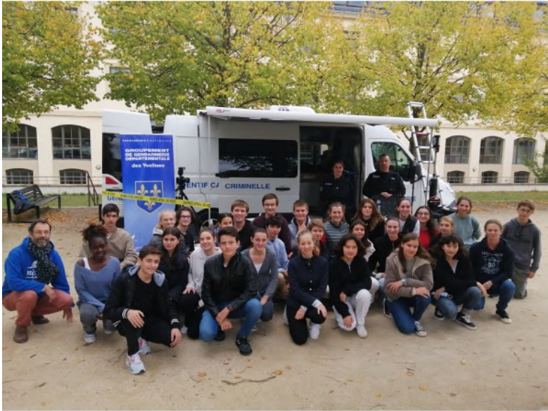
Les Techniciens d'Identification Criminelle au lycée Hoche – 05/10/2022