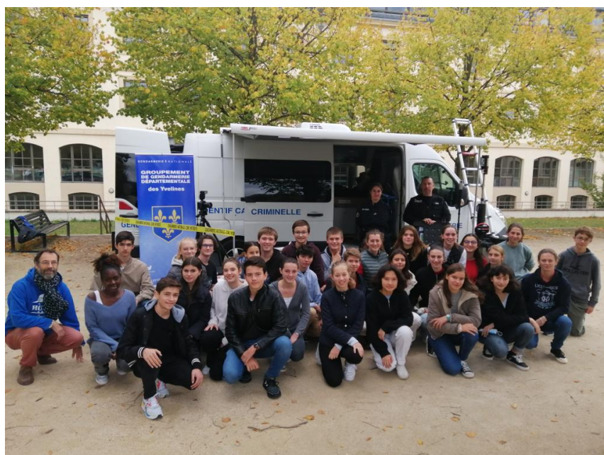
La Classe Défense à la recherche du coupable!