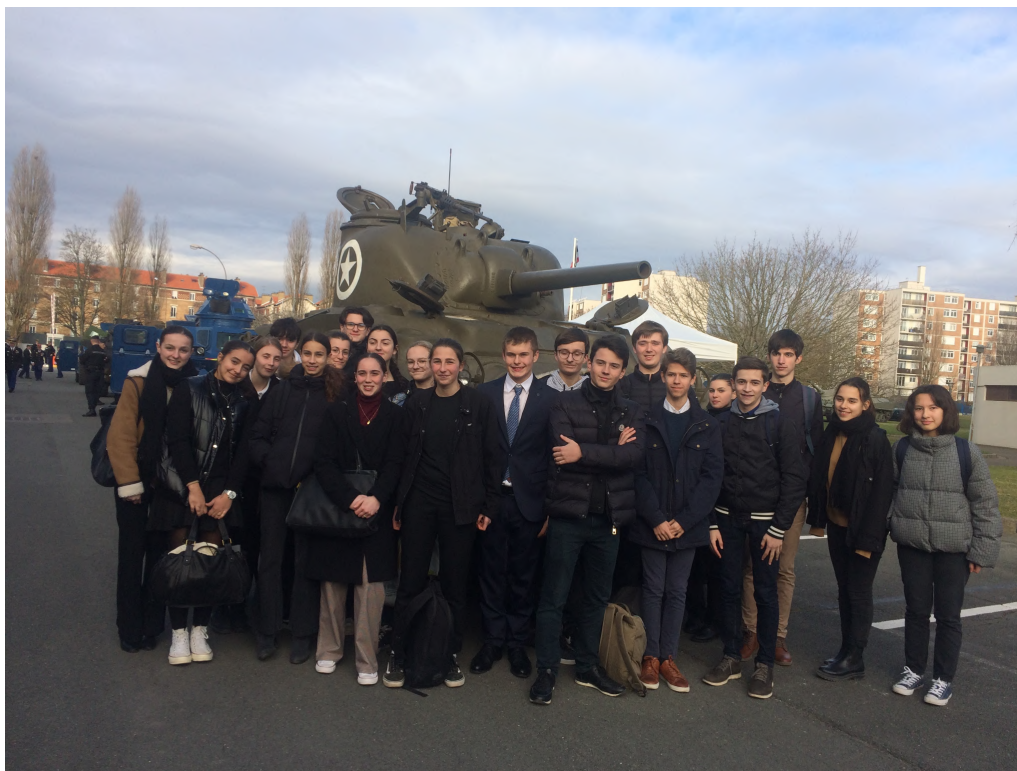
Élèves de la CDSG devant un char au GBGM à l'issue de la cérémonie

Jeudi 16 février 2023, la Classe Défense s'est jointe aux militaires de la Gendarmerie nationale pour rendre hommage aux gendarmes morts pour la France. Les élèves ont eu l'honneur d'assister à la décoration de l'étendard du GBGM, qui a reçu la croix de guerre 39-45 avec palme de bronze ; celle-ci symbolisant le courage et l'abnégation des anciens combattants. Pour clôturer la cérémonie des véhicules blindés de type AM8, CHAR M4 SHERMAN, VAB et VBRG ont défilé.