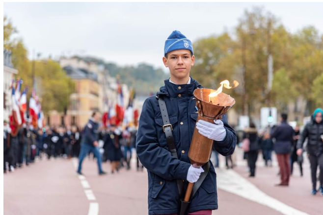
Photographies illustrant la participation active de la CDSG (@Ville de Versailles, @M. Roucaud, @H. Fache