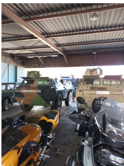
Les VBG au second plan