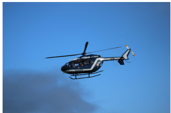
L'EC-145 en vol