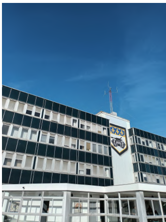
Bâtiment du GBGM

A l'issue de la présentation, la classe a été séparée en deux groupes. Tandis que l'un découvrait l'équipement, l'armement et les moyens utilisés pour le Maintien de l'Ordre (MO) c'est-à-dire particulièrement lors des manifestations, l'autre groupe découvrait les Véhicules Blindés de la Gendarmerie (VBG), le DRAP (Dispositif de Retenu Autonome du Public) ainsi que le nouveau blindé, le Centaure, qui a pour vocation de remplacer les anciens blindés. 90 exemplaires sont prochainement attendus au GBGM de Versailles. Les élèves ont pu échanger avec quelques gendarmes mobiles présents et en apprendre davantage sur cette spécialité de la Gendarmerie.