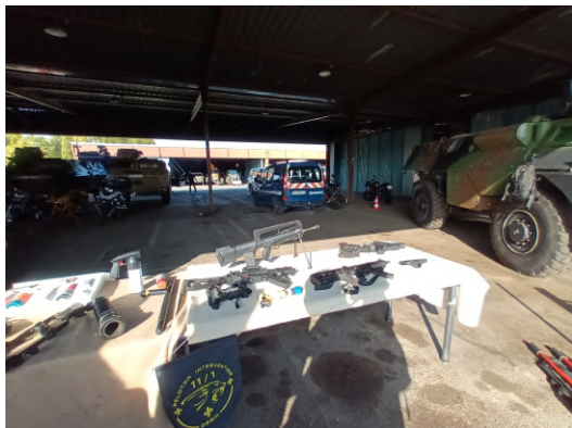
Dotation armement des gendarmes mobiles

Les élèves ont ensuite assisté à une présentation du matériel et des engins motorisés du Peloton d'Intervention.