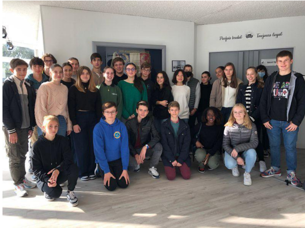
Photo de groupe devant la devise du GBGM "Parfois brutal, toujours loyal"