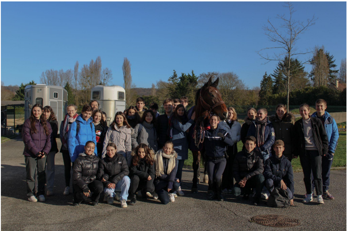
Photo de groupe au PAC de Saint-Nom-la-Bretèche