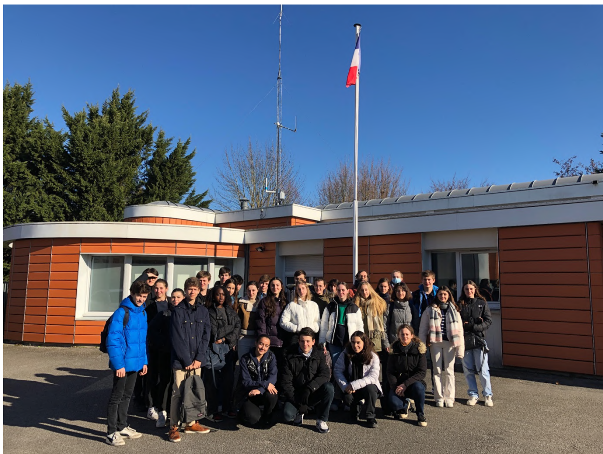
La Classe Défense à la Brigade Territoriale Autonome de Magny-les-Hameaux (78)

Le mercredi 8 février 2023, nous sommes allés à la rencontre des gendarmes de la Brigade Territoriale Autonome de Magny-les-Hameaux intégrée au sein de la Gendarmerie Départementale. Nous avons découvert une cellule de garde à vue et de détention provisoire. Nous avons testé les modalités d'identification par empreintes digitales. Cette visite nous a permis de prendre conscience du cœur de métier de la gendarmerie nationale dans les missions spécifiques de la Gendarmerie départementale.