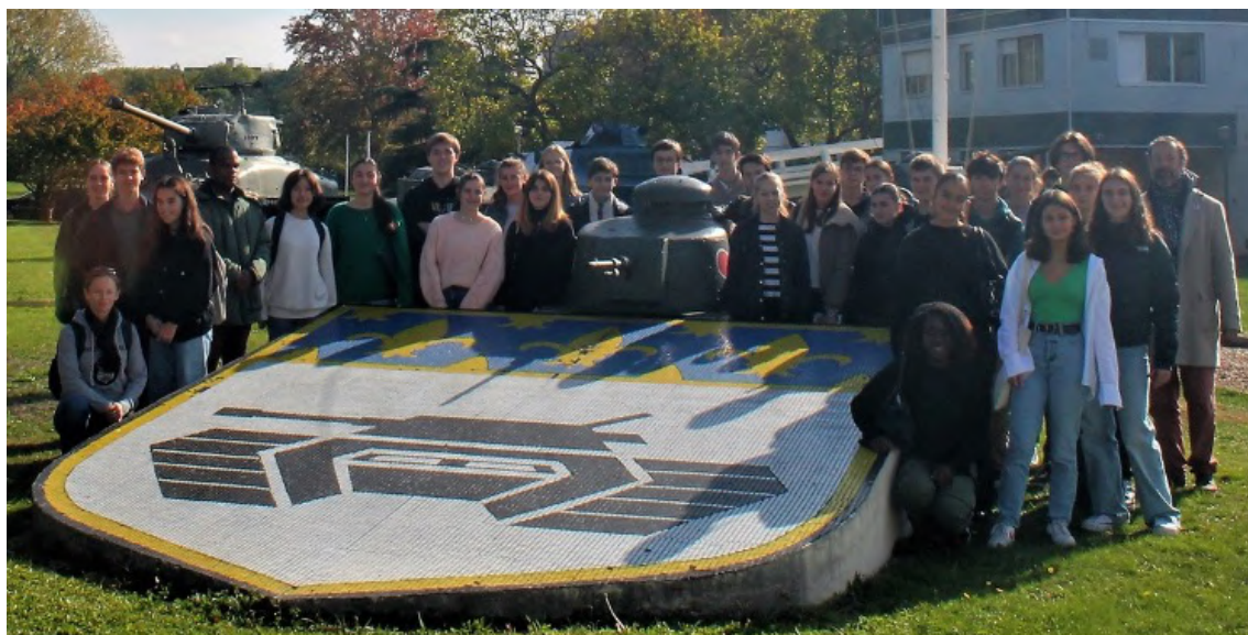
Visite du GBGM à Satory – 28/09/2022

Nous sommes une classe motivée : nous nous réunissons 2 heures minimum par semaine pour atteindre ces objectifs en rapport avec l'engagement citoyen, le devoir de mémoire et la participation à la Défense Nationale.