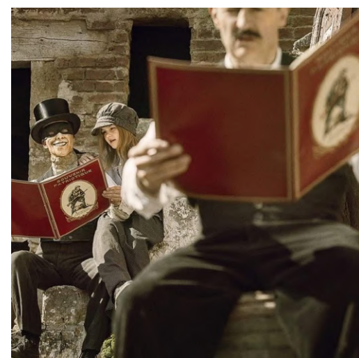
Images extraites du film

La projection s'est prolongée avec un débat animé par le Directeur de l'Office National des Anciens Combattants et Victimes de Guerre (ONAC-VG) qui portait sur la Première Guerre mondiale et particulièrement sur "Les gueules cassées".