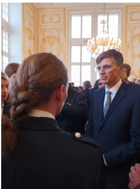
Échanges avec M. le Maire

Les professeurs et certains élèves ont ensuite pu échanger avec M. le Maire au sujet de la CSDG du Lycée Hoche et des projets à venir.