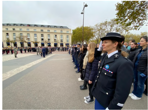
Hommage et recueillement