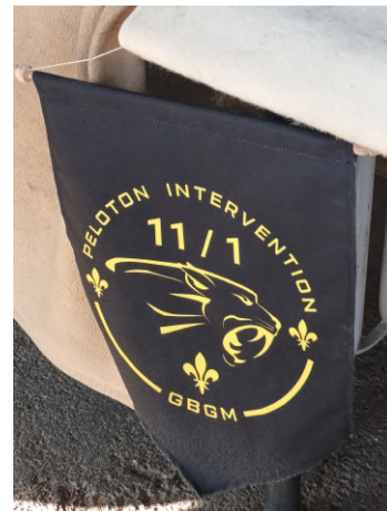
Fanion du Peloton d'Intervention de l'escadron 11/1