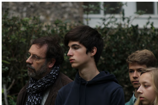
Une minute de silence - Hommage