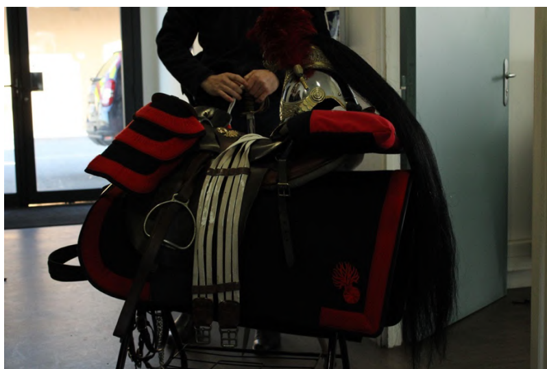
Équipement de cérémonie du cheval de la Garde Républicaine