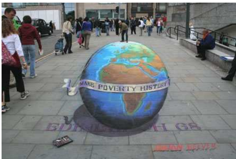
La photo vue du bon angle

http://www.julianbeever.net/index.php?option=com_content&view=article&id=1&Itemid=1