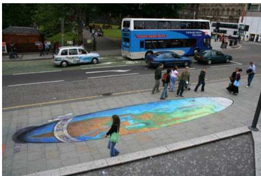
La photo vue d'ailleurs