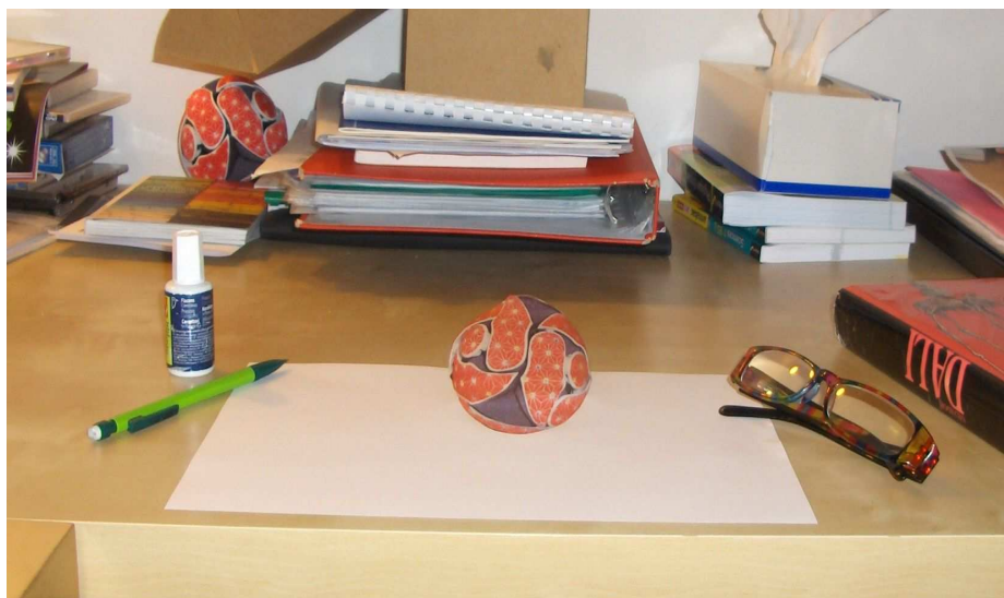
Anamorphose sphère Réalisé par anamorphMe