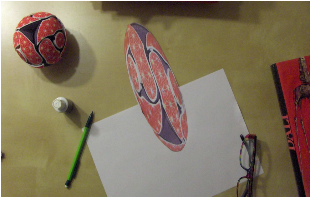
Réalisation de l'anamorphose sphère