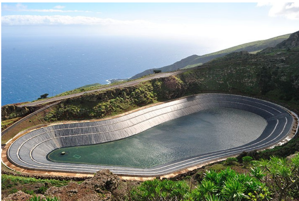
STEP d'El Hierro en Espagne

La STEP fonctionne entre deux retenues d'eau, un bassin inférieur et un bassin supérieur (voir schéma). Aux heures de très forte consommation électrique sur le réseau, l'eau du bassin supérieur, captée par une conduite forcée, fait tourner une turbine et un alternateur qui produit de l'électricité.